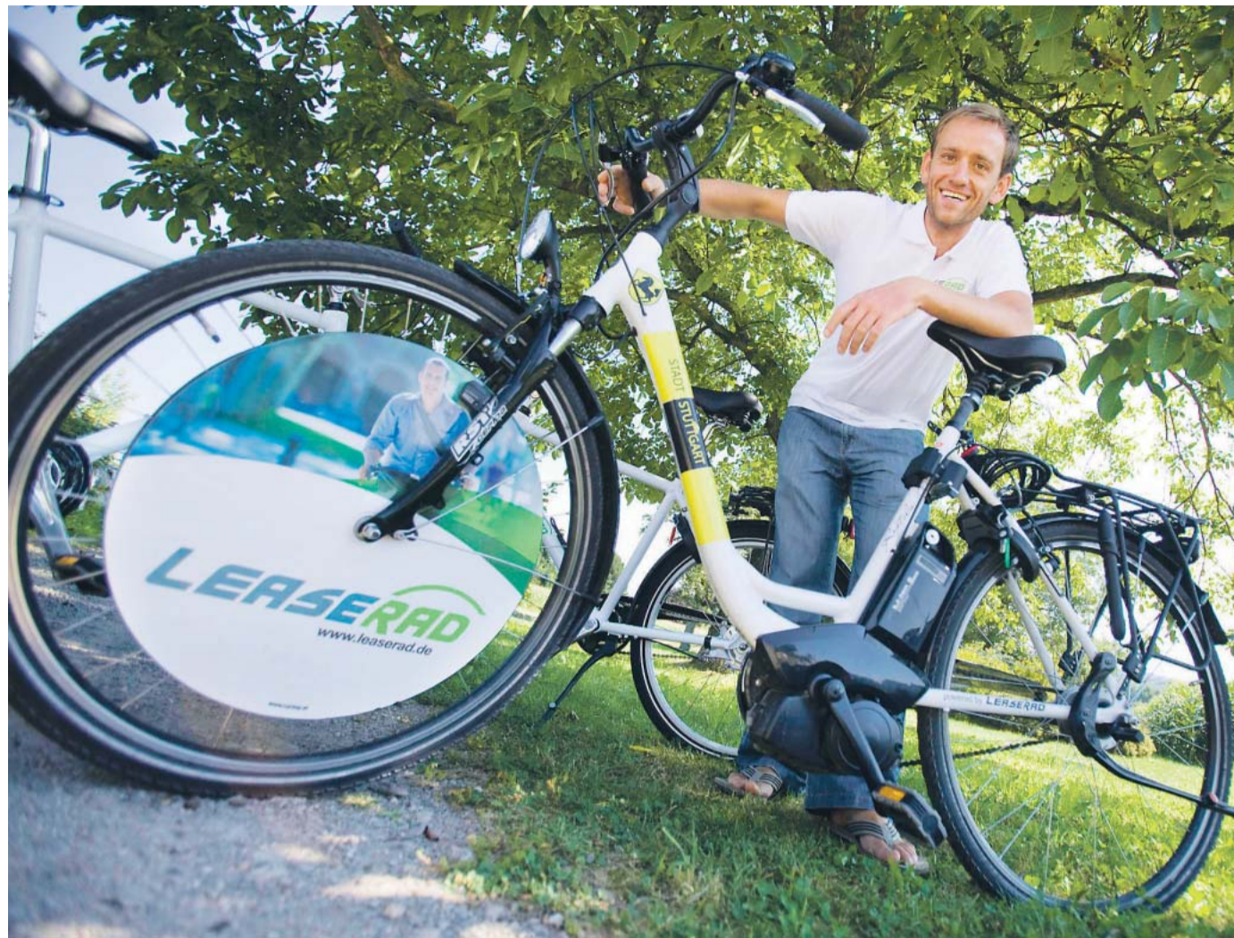
Schwäbisches Dienstfahrzeug: Stuttgart rüstet seit einem halben Jahr die Stadtverwaltung mit Elektrorädern aus.